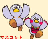
埼玉県マスコット 「コバトン・さいたまもち」

発行:埼玉県立総合教育センター 企画調整担当 Tel:048-556-3319(直通)